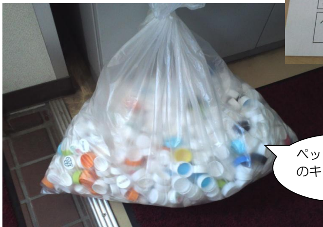
ペットボトルのキャップ