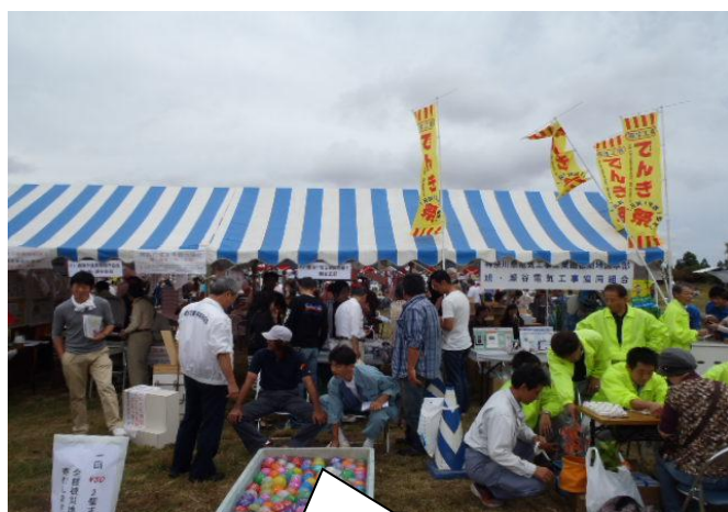
せやフェスティバル